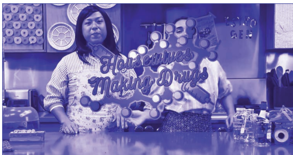
FIG. 4 | Photogramme de la vidéo « Housewives Making Drugs », 2017.