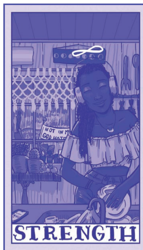
FIG. 1 | Carte « Strength » issue du Delta Enduring Tarot .

14 Le sigle renvoyant aux minorités queer , parfois nommé « soupe alphabet » (« alphabet soup ») tant il ne cesse de multiplier les lettres pour renvoyer à des groupes auparavant minorisés est parfois critiqué pour son aspect illisible ou cryptique. Sam Bourcier choisit à raison de l'allonger encore pour lui associer l'acronyme POC ( People of Color ), les personnes racisées n'étant jamais rentrées selon lui dans la « soupe alphabétique » (2017, 51).